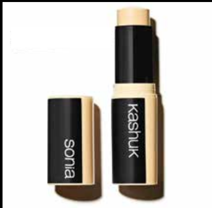
ALMOND - No.F11